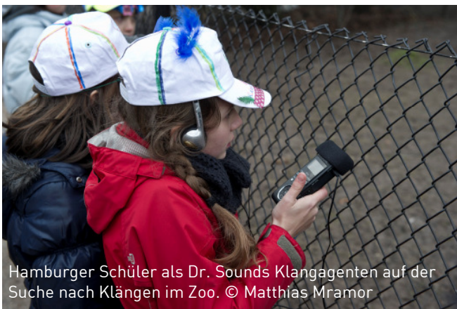
Hamburger Schüler als Dr. Sounds Klangagenten auf der Suche nach Klängen im Zoo.

Erfolgreiches Musikvermittlungsprojekt erhält in der nächsten Saison einen zusätzlichen Spielort. Durch großzügige Spenden kann in der Spielzeit 2011/12 für die Kinder-Konzertreihe „Dr. Sound im Einsatz“ ein zusätzlicher Spielort finanziert werden.