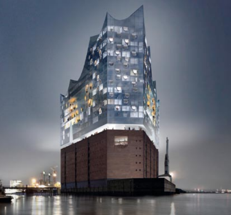
Abbildungen: Herzog & de Meuron, Gestaltung: www.cqart.de

Bauherr: Elbphilharmonie Hamburg Bau GmbH & Co. KG, vertreten durch die ReGe Hamburg Projekt-Realisierungsgesellschaft mbH, Veritaskai 3, D-21079 Hamburg, info@elbphilharmonie.de, www.elbphilharmonie.de